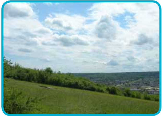
Vernon, vue de la Colline aux Oiseaux

Côté sud, les chemins traversant Bizy, Saint-Marcel, Saint-Just et Saint-Pierre d'Autils vous offrent de beaux paysages champêtres.