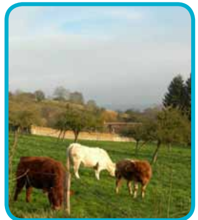
Saint-Pierre d'Autils, vu de St Just

► Prendre le départ du « Sentier des Jeunes pousses » à la salle des fêtes de la Chapelle Réanville (7,5 km) et pour profiter de la vue sur la vallée en passant par Villez-sous-Bailleul.