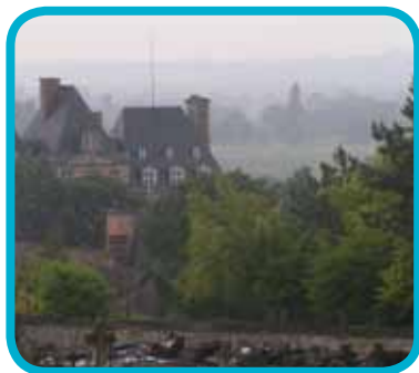
Château de Menilles, vu de la côte blanche

▶ Ce circuit part des «3 étangs» à Jouy-sur-Eure (12,5 km).